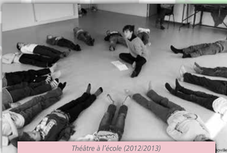
Théâtre à l'école (2012/2013)