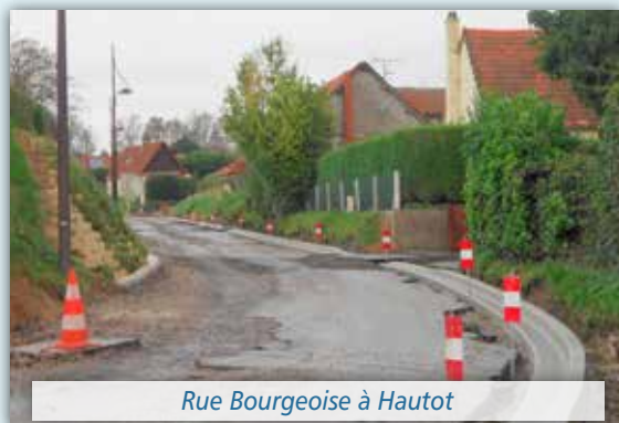
Rue Bourgeoise à Hautot

Auxquels s'ajouteront quelques travaux complémentaires.