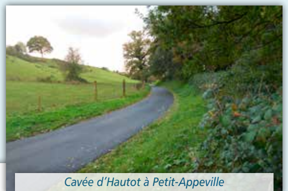
Cavée d'Hautot à Petit-Apperville