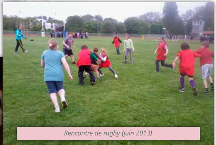
Rencontre de rugby (juin 2013)