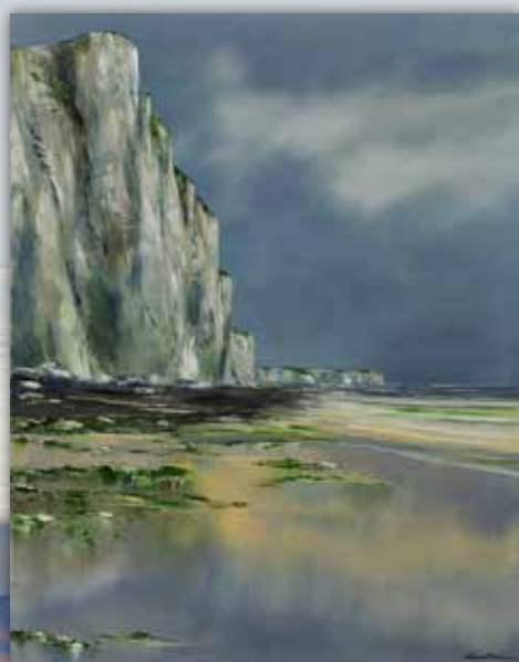
La haute falaise Huile sur toile Dimensions 92 x 73 cm