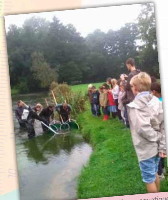
Pêche électrique (comptage de la faune aquatique) sur le bord de la Scie