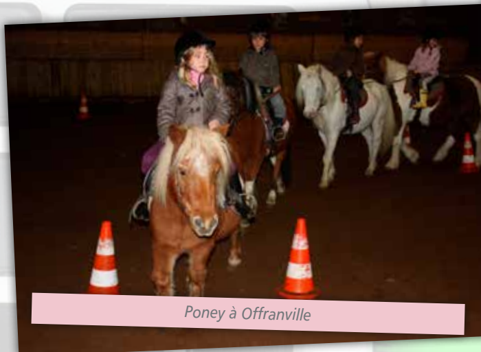
Poney à Offranville