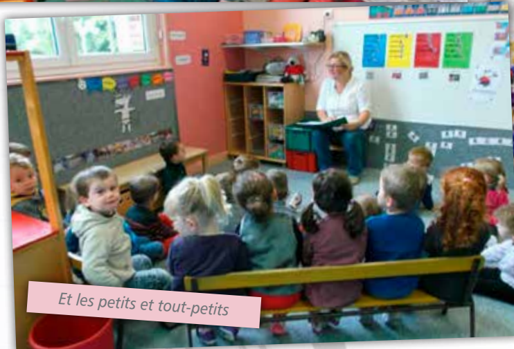
Et les petits et tout-petits