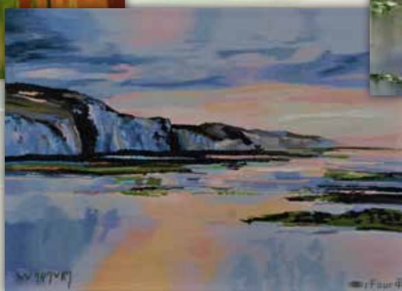
Tapisserie d'Aubusson Coucher de soleil à Pourville Dimensions 155 x 100 cm

La rétrospective de l'œuvre de l'artiste est à voir :