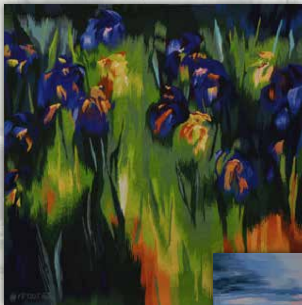
Tapisserie Les iris Dimensions 130 x 135 cm

Les visiteurs pourront en outre découvrir des tapisseries contemporaines réalisées d'après ses œuvres, tissées par les ateliers d'Aubusson dont le travail a été reconnu au patrimoine immatériel mondial de l'UNESCO.