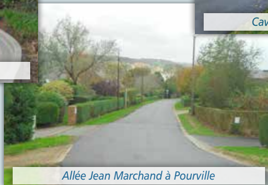
Allée Jean Marchand à Pourville